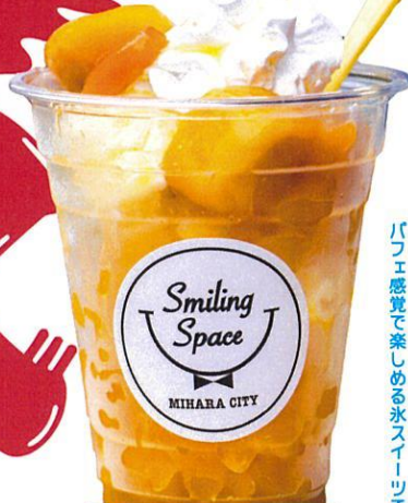
Smiling Space 氷パフェ マンゴー

小さくパイとパナッアイス、 そして三原で獲れたイチゴをたっぷり使った、 COGUMAYA自慢のかき氷が登場。 あま〜い果肉を存分にお楽しみください。