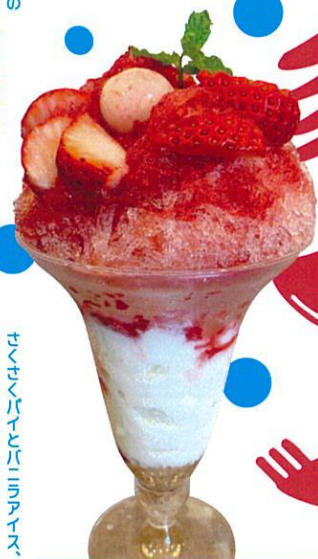
Patisserie COGUMAYA 三原いちごカキ氷

小さくパイとパナッアイス、 そして三原で獲れたイチゴをたっぷり使った、 COGUMAYA自慢のかき氷が登場。 あま〜い果肉を存分にお楽しみください。