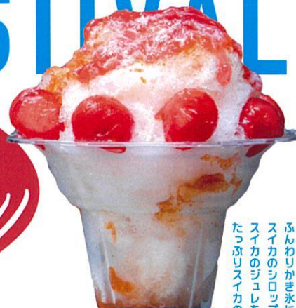
cafe 3g スイカのかき氷

佐木島産・島たまごの ミルクケーキを凍らせてかき氷の中に、 島たまごのプリンがかくれんぼ。 島たまごの美味しさがかっぶり!